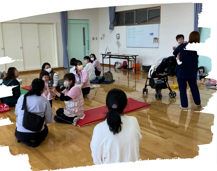
前回の南部保健センター交流会様子