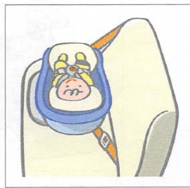
● 横向き取り付けタイプ