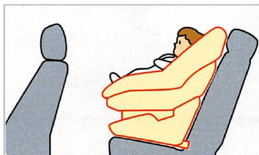
幼児（1歳～4歳くらい）に使用するとき