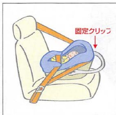
後ろ向き取り付けタイプ ● 3点固定式