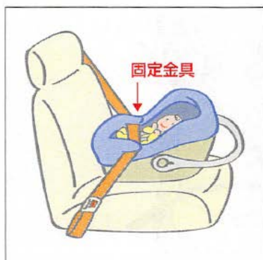
後ろ向き取り付けタイプ ● 2点固定式

乳児期は首が据わっていないため、寝かせるタイプになっています。後ろ向きに使用する「シートタイプ」と横向きに使用する「ベッドタイプ」があります。赤ちゃんを乗せたまま車に乗せ降ろしができるのが特徴です。