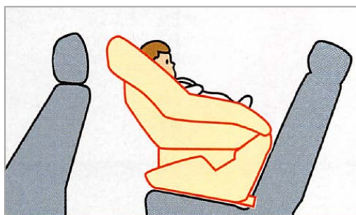
乳児（新生児～1歳くらい）に使用するとき

兼用タイプは、使用時期によって装着の仕方や使用方法が異なりますので、お手持ちのマニュアルをよく読んで正しく使用しましょう。